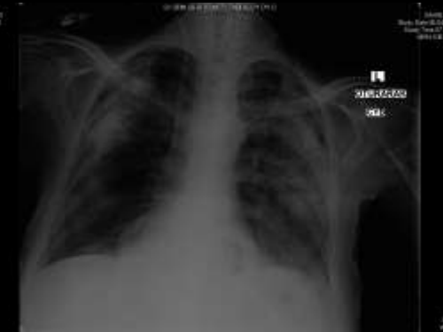
Post- ECMO Göğüs Filmi