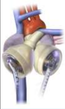
Total Yapay Kalp