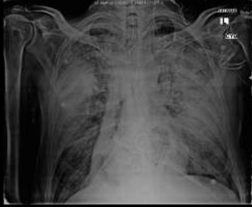
Pre- ECMO Göğüs Filmi